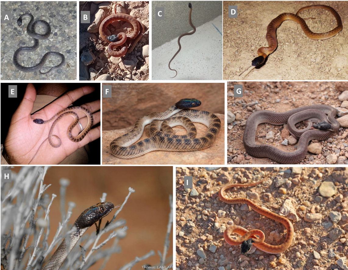
Figure 2 : Photographies de spécimens de la Couleuvre-chat d'Afrique du Nord ( Telescopus tripolitanus ) rapportés dans cette étude (localité et auteur de la photo) : A - Tinejdad, O. Derrouga ; B - Ouarzazate, A. Benamar ; C - Agdez, A. Ahmed ; D - Tassaouant, A. Lansari ; E - Bou-Ouazzer, A. Bouazza ; F - Assa, F. Deschandol ; G - Aouinet Lahna, A. Bouazza ; H - Jbel Ouarkiziz, T. Lahlafi ; I - Lemsyed, A. Rihane. Figure 2: Pictures of the North-African Cat Snake Telescopus tripolitanus reported in this study (locality and author): A - Tinejdad, O. Derrouga ; B - Ouarzazate, A. Benamar ; C - Agdez, A. Ahmed ; D - Tassaouant, A. Lansari ; E - Bou-Ouazzer, A. Bouazza ; F - Assa, F. Deschandol ; G - Aouinet Lahna, A. Bouazza ; H - Jbel Ouarkiziz, T. Lahlafi ; I - Lemsyed, A. Rihane.